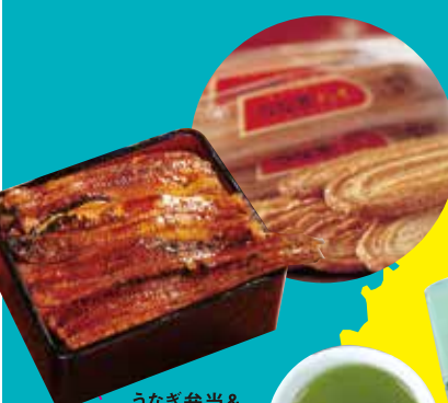
うなぎ弁当 & うなぎパイ