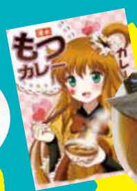
静岡おでん & 清水もつカレー